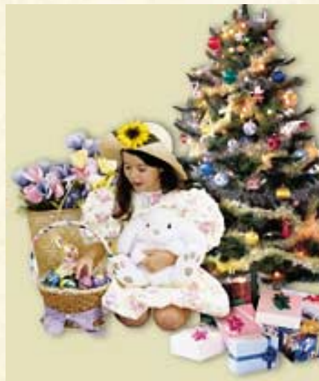
Joulu ja pääsiäinen ovat peräisin muinaisista vääristä uskonnoista

7. Joidenkin näiden uskonkäsitysten ja tapojen hylkääminen voi olla hyvin vaikeaa. Sukulaiset ja ystävät yrittävät ehkä taivutella sinua pysymään entisissä uskonkäsityksissäsi. Jumalan miellyttäminen on kuitenkin tärkeämpää kuin ihmisten miellyttäminen. (Sananlaskut 29:25; Matteus 10:36, 37.)