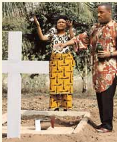
Ei ole mitään syytä palvoa eikä pelätä kuolleita