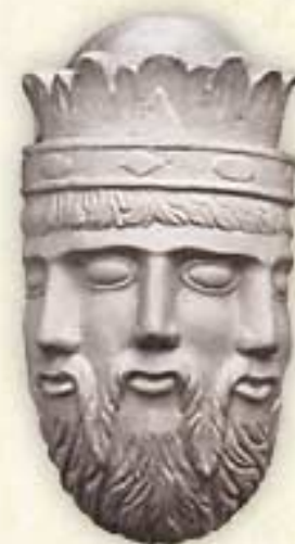
Jumala ei ole kolmiyhteinen

4. Syntymäpäivät : Raamatussa puhutaan vain kaksista syntymäpäiväjuhlista, ja niitä viettivät ihmiset, jotka eivät palvoneet Jehovaa (1. Mooseksen kirja 40:20–22; Markus 6:21, 22, 24–27).